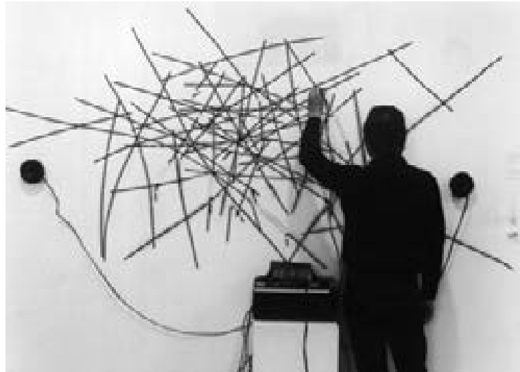
Nam June Paik. Random Access Music (1963)

En Random Access Music (1963) Nam June Paik recorta una cinta magnetofónica y pega los fragmentos en la pared, invitando al visitante a escuchar su contenido pasando con su mano el lector del magnetófono que previamente había desarmado de un radiocasete. La interacción del espectador permite de este modo experimentar el medio y la información sonora de una forma más participativa y personal.